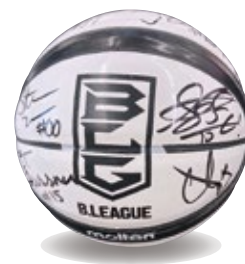
全選手サイン入りボール